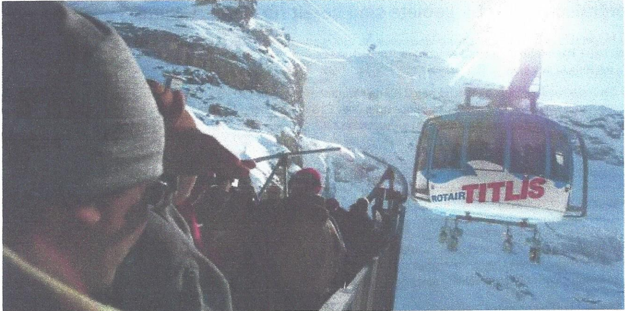
Die Bergbahn Titlis in Engelberg OW.

Referenz: 79140203 Ausschnitt Seite: 2/2