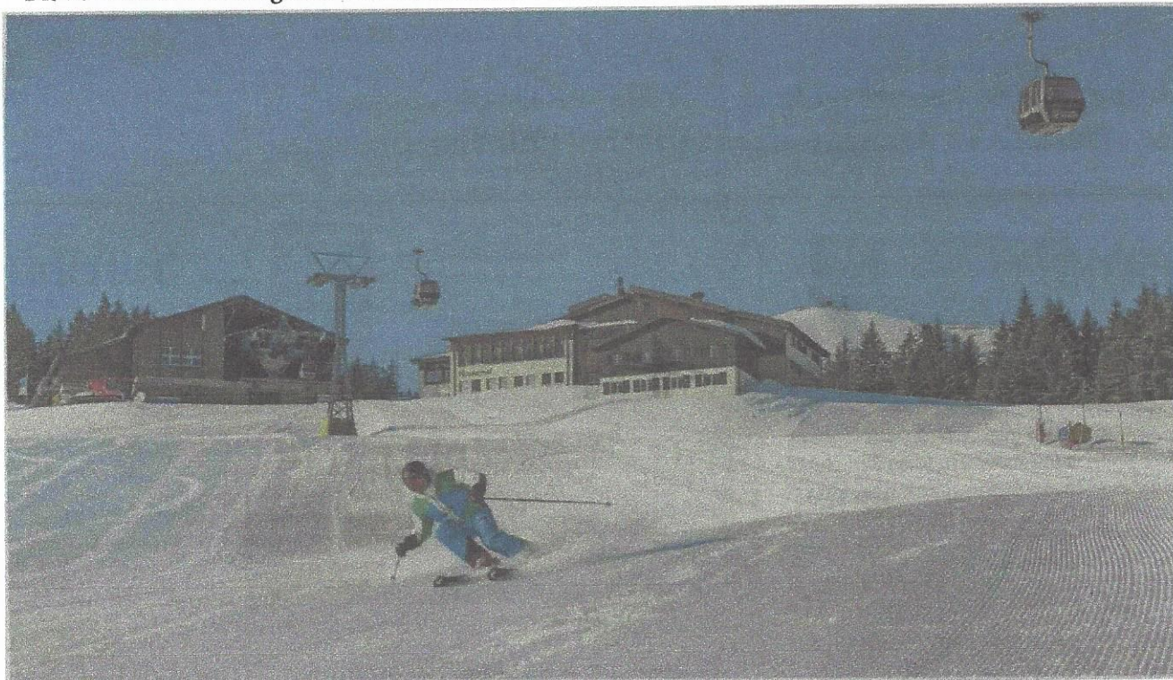
Die Bergbahn und das Erlebnisrestaurant Rossweid in Sörenberg sind bereit für die Skisaison.

Die Zentralschweizer Skigebiete sind bereit für den «Corona-Winter» und haben in Schutzmassnahmen investiert.